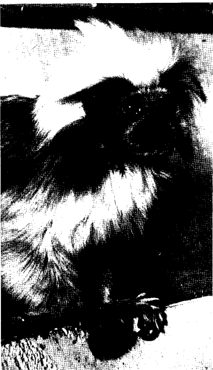
Opice pinč - Leontocebus oedipus

Rovněž byl doplněn stav klokanů, kteří dnes patří mezi vzácné exponáty a na světových trzích se objevují velmi sporadicky, protože Austrálie nepovoluje jejich vývoz.